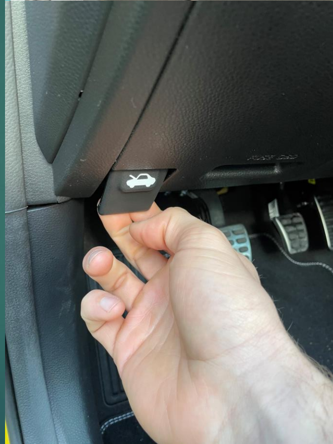
Hendel bij deur bestuurderszijde