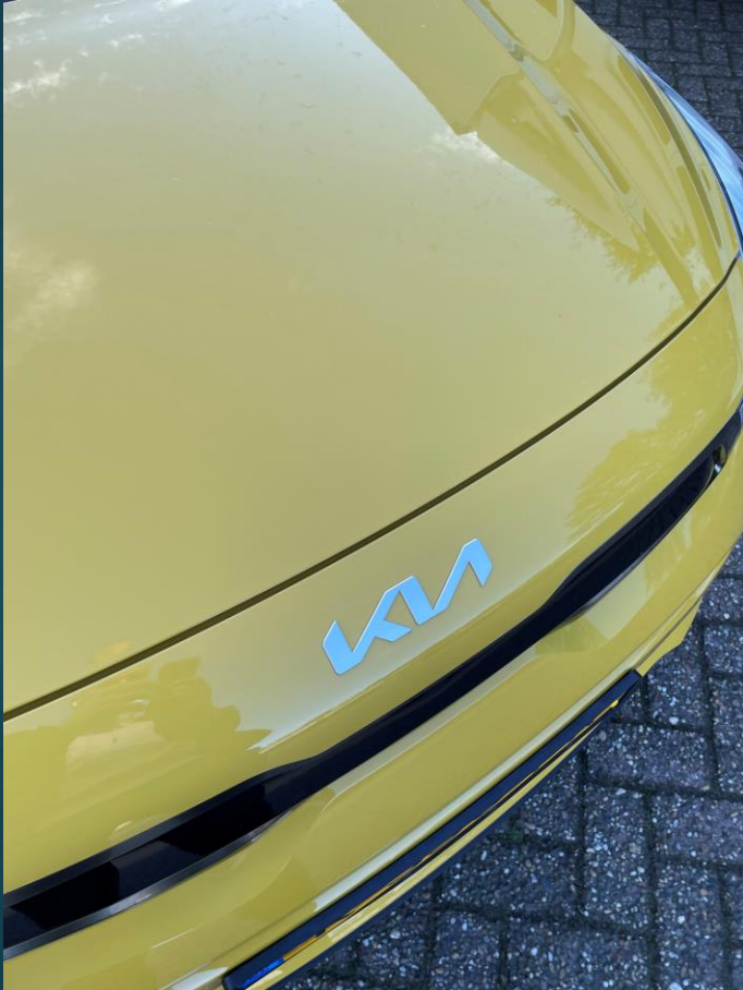
Motorkap in gesloten toestand